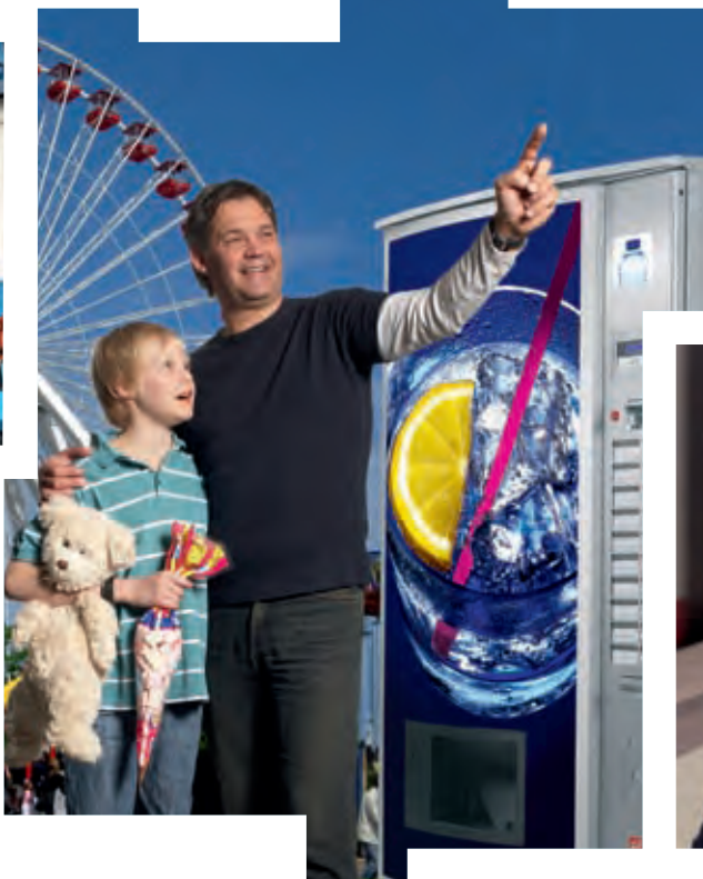
FK 280 Outdoor