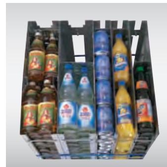
1-fach bis 4-fach Produktlagerung in der FK-Serie