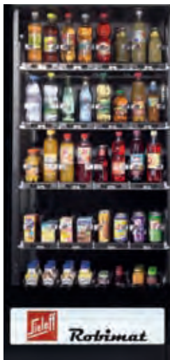
Mögliche Bestückungsvariante im Robimat 99