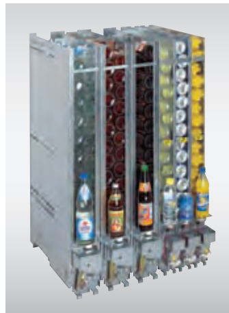
Normal- und Schmalschächte für die FK-Serie