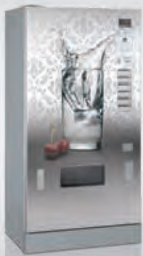
FK 170 im CV-Design

Mögliche Optionen sind unter anderem der Eingreifschutz bei der Produktausgabe und die abschließbare Kasseneinheit als Diebstahlschutz. Der Flaschenöffner mit Auffangbehälter zeigt, dass der Sielaff-Servicegedanke in jedem Detail steckt.