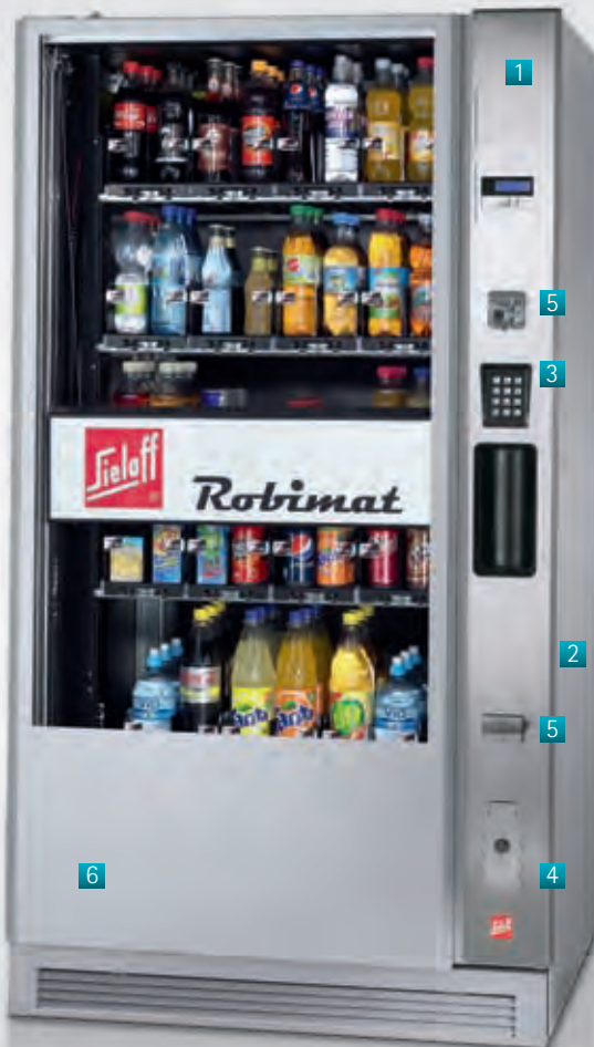
Robimat 99 im High-Security-Design

Schnell und spektakulär: Das faszinierende Sielaff-Liftsystem macht die nahezu schüttelfreie Produktausgabe zur Verkaufsshow, die höchstens 10 Sekunden dauert. Zwischen zwei Verkäufen zieht der programmierbare Werbelauf des Lifts permanent die Aufmerksamkeit auf sich.