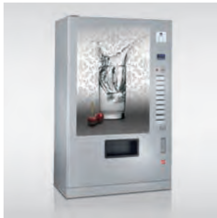
FK 230 im FT-Design