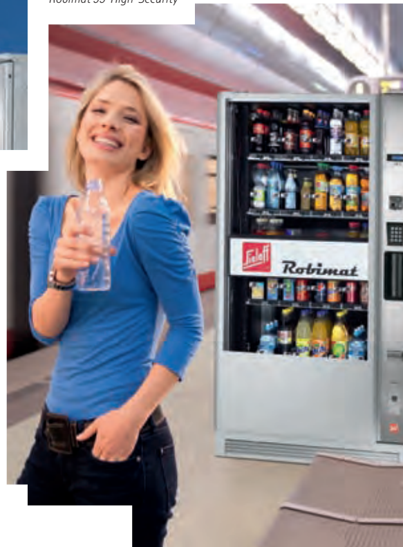
Robimat 99 High-Security