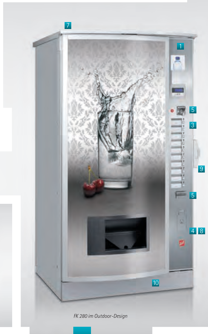
FK 280 im Outdoor-Design