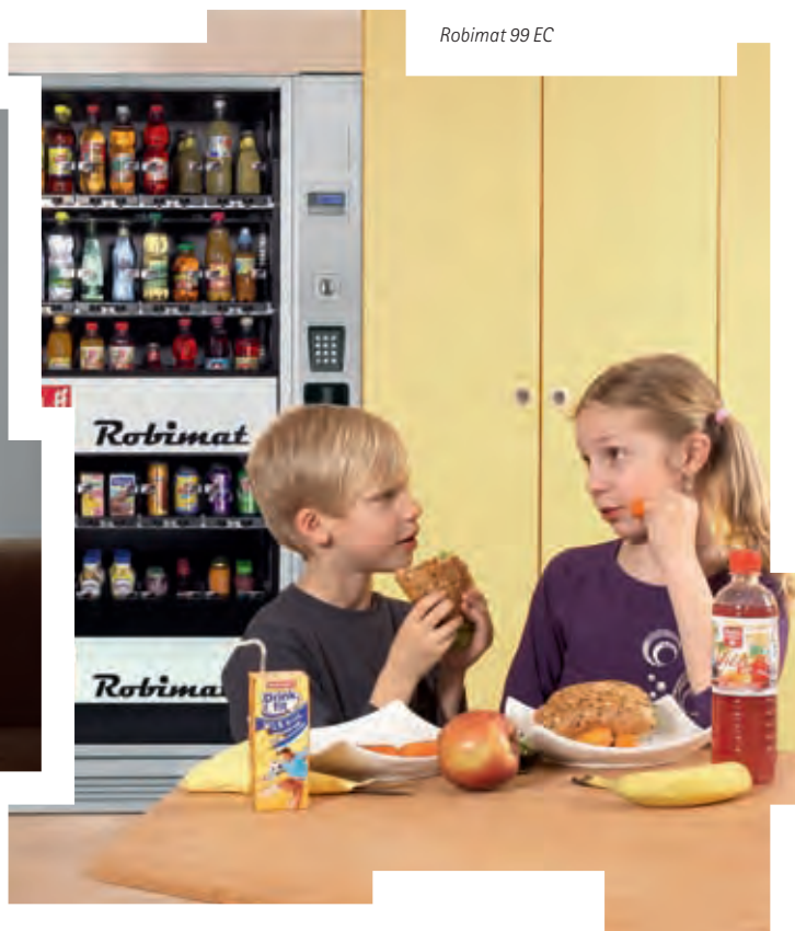
Robimat 99 EC