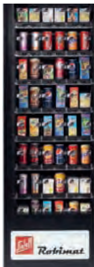
Mögliche Bestückungsvariante im Robimat 75

Die beiden Warenfachbreiten des Robimats erlauben eine enorme Produktvielfalt. Bis zu 48 bzw. 64 unterschiedliche Getränke in Gebindegrößen von 0,2 bis 1,25 Liter kann der Robimat verkaufen. Das First-in-first-out-Prinzip garantiert bei beiden Versionen, dass zuerst aufgefüllte Getränke zum Verkauf gelangen. Die Ausgabe – beim Robimat mittels Liftsystem – funktioniert dabei weitestgehend schüttel- und erschütterungsfrei.